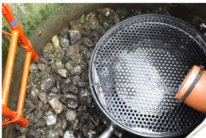
Tropfkörperkleinkläranlage: Zu sehen ist eine Anlage, welche im Freigefälle funktioniert. Eine Abwasserverteilverrichtung berieselt periodisch vorgereinigtes Abwasser über den Tropfkörper. Dort erfolgt der biologische Abbau der Schmutzstoffe.

Beat Stauffer, Amt für Umweltschutz Schwyz beat.stauffer@sz.ch