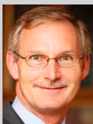
Regierungsrat Andreas Barraud Vorsteher des Umweldpartements des Kantons Schwyz

Wussten Sie, dass zu den nicht erneuerbaren Ressourcen auch Phosphor gehört und dass wir Menschen ohne Phosphor nicht leben können? Was dieses Thema mit Abwasser zu tun hat – lesen Sie dazu mehr in diesem Newsletter.