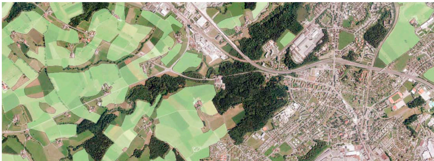
Westlich von Emmen und dem Riffigwald: Die hellgrün markierten Flächen sind gesicherte Fruchtfolgefleichen.

Die Schweizer Landwirtschaft soll auch in Krisenzeiten genügend Nahrungs- und Futtermittel produzieren können. Deshalb gibt der Bund den Kantonen vor, wie viele Hektaren ackerfähigen Bodens sie dauerhaft erhalten müssen. Der Kanton Luzern nimmt diesen Auftrag – wie andere Kantone – wahr und wird diesen Flächen bei raumwirksamen Tätigkeiten vermehrt Beachtung schenken.